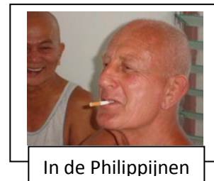
In de Filippijnen

In 1966, terug in Nederland, met een indrukwekkende lading kennis in onder andere Ne waza.