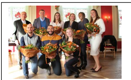
Inter(nationale) coaching succes

Hij heeft nationaal en internationaal veel respect afgedwongen en contacten gecreëerd in en buiten de Judowereld en is een van de hoogste Dan houders in Nederland met de 9 e Dan IJF .